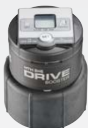
Ecran LCD avec touche de réglage (1 à 12 mois) + fonction purge