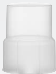
Capuchon de protection